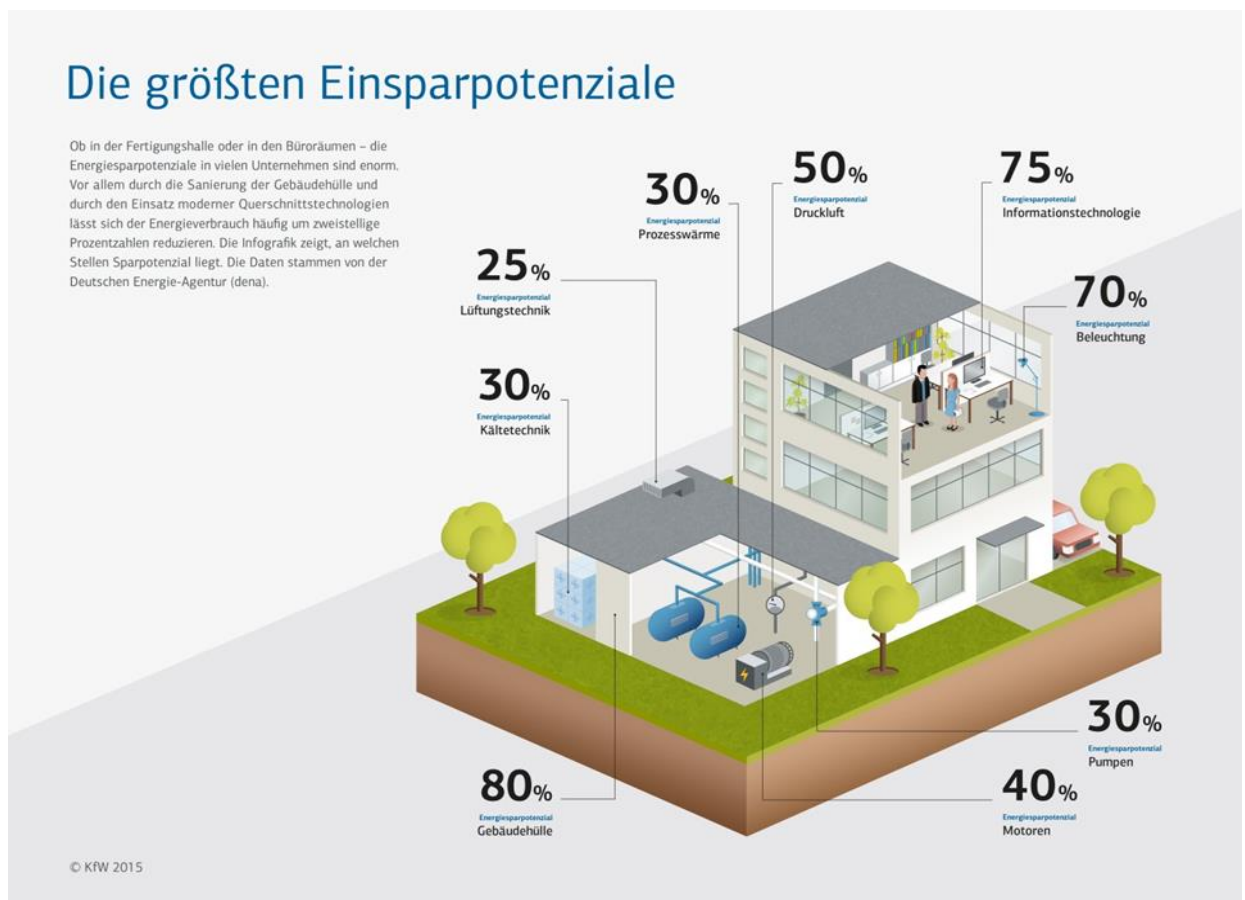
Abbildung eines virtuellen Firmengebäudes mit möglichen Energieeinsparungen.

https://www.kfw.de/Presse-Newsroom/Themen-Kompakt/EEU/Firmengeb%C3%A4ude.jpg